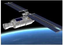
항공우주 및 방위