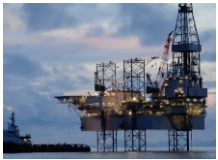
석유 및 가스 / 에너지