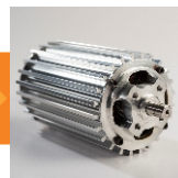
Integración de sistemas