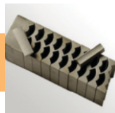
Fabricación de imanes