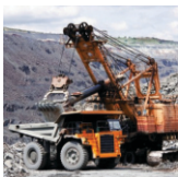
Minería y procesamiento

Cadena de suministro totalmente integrada, de la mina al sistema